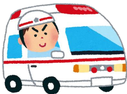
急病やケガのとき