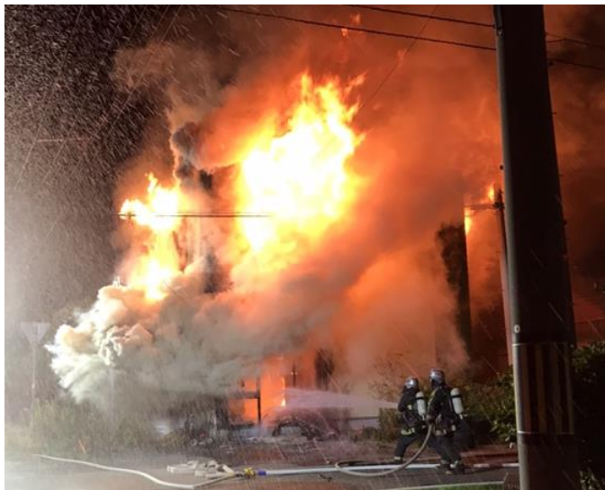
石狩市で発生した火災の様子

出火原因については現在、調査中のものもありますが【放火】、【たばこ】が原因と考えられるものが多く発生しています。